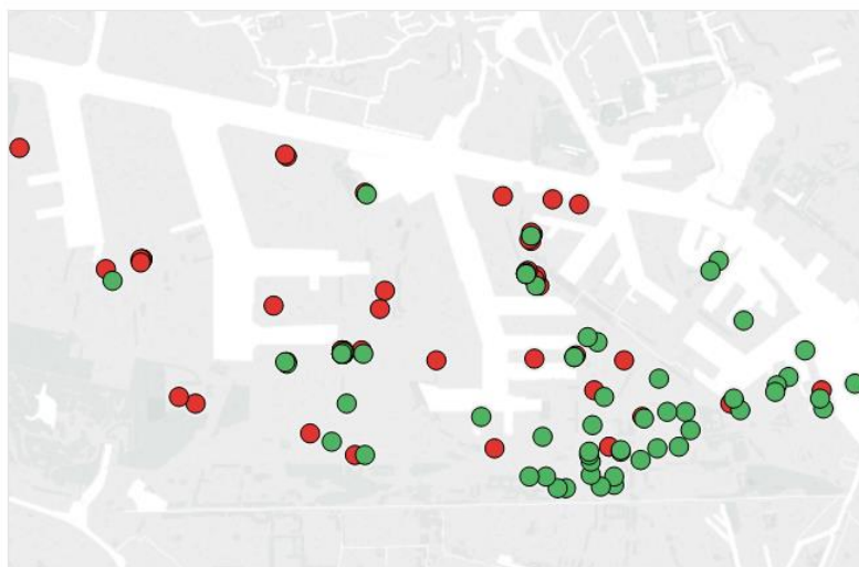
Figuur 1.2 Realisatie opkomsttijden voor binnenbranden in de haven

Heeft de brandweer de normtijd voor de aanwezigheid gehaald? ■ wel gehaald ■ niet gehaald